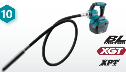
จี้คอนกรีต ให้คอนกรีตแน่น