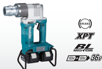
ขันน็อต TC Bolt