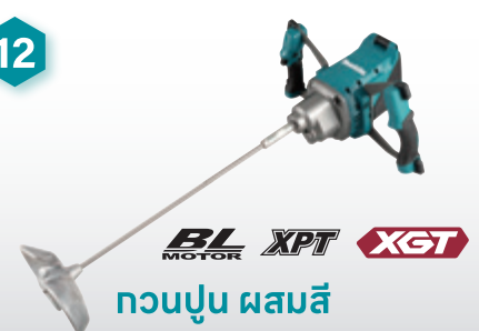
กวนปูน ผสมสี