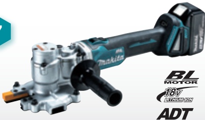
ตัดเหล็กข้ออ้อยส่วนเกิน