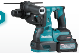
เจาะผนังคอนกรีตเดินสายไฟ